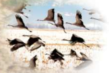
Kranichzug im Frühjahr und Herbst